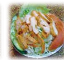
チキンサラダ Chicken Salad