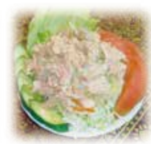
ツナサラダ Tuna Salad