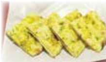
オニオンクルチャ Onion Kulcha