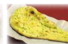
パンプキンナン Pumpkin Nan