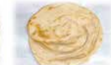
ラチャパラタ Lachha Paratha