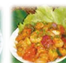
ブラウンマサラ Prawn Masala