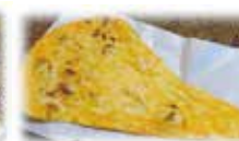
ガーリックナン Garlic Nan