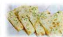
パニールクルチャ Paneer Kulcha