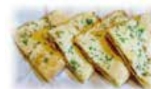
ベジタブルスタッフドクルチャ Veg Stuffed Kulcha