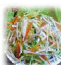
クチュンバラサラダ Kuchumbar Salad