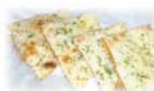
ツナクルチャ Tuna Kulcha