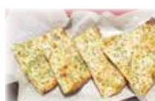
チーズナン Cheese Nan