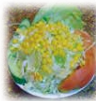
グリーンサラダ Green Salad