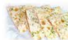
キーマ ナン keema Nan