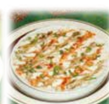
インディアンライタ Indian Raita