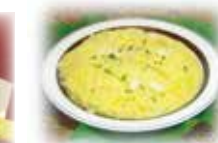
サフランライス Saffron Rice