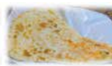
カブリナン Kabuli Nan